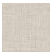
MELAMINA CAIRO LINO