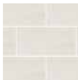
PORCELANATO PLANET BONE