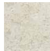
MÁRMOL CREMA LISBOA