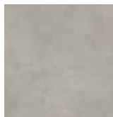
PASTA LISA TEXTURA SEMI RÚSTICO