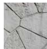
PIEDRA LAJA CANTERA SAN ANDRÉS